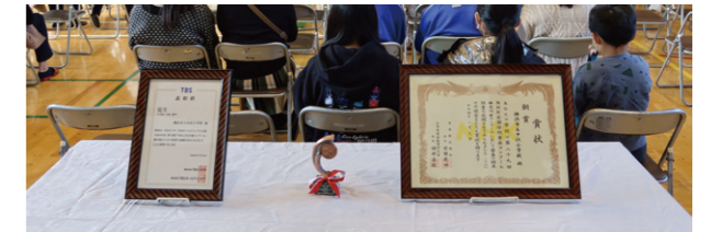
左が地区大会の優秀賞 右が県大会の銅賞