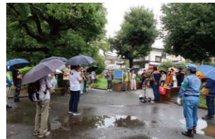
消防署員による機材の説明

<編集後記>3年ぶりとなる「敬老のつどい」を開催することができました。コロナ禍で様々なイベントが中止となる中で、再開するためにはどのような基準を満たせば可能となるのか、正に手探りの状態でした。周りの動きを注視して独自に判断するしかなく、石橋を叩いて渡るような慎重さが求められましたが、感染対策を十分にとった上で、開催に漕ぎつきました。3年ぶりです。改めて思ったのは、地域住民にとって会場の準備作業それ自体が一大イベントということ。ご協力いただきありがとうございました。皆さま、良いお年をお迎えください。