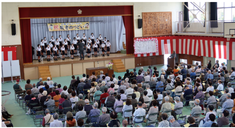
中沢小合唱団の素敵な歌声が体育館に響き渡ります