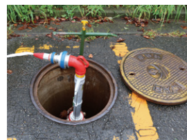
スタンドパイプを接続