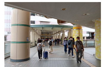
10月5日(水)の連絡通路