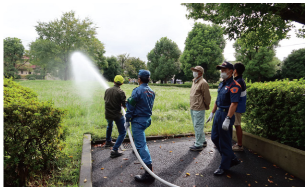
皆さんで順番に放水作業を体験します

9月24日(土)に「あぎにれ公園」で連合町内会主催の5回目となる初期消火訓練(約30名参加)を実施しました。引き続き、10月8日(土)に西部町内会が、11月12日(土)には南部町内会が、いずれも「きのご公園」で町内会ごとの訓練を実施しました。機材を使用する際は、黄色にペイントされたマンホール蓋の下に設置されている「路上消火栓」にスタンドパイプを接続します。ニュータウン地区には150箇所ほど(推定)がありますので、散歩ついでに確認してみても如何でしょうか。