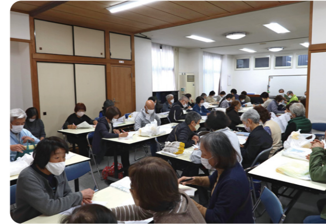
並木愛護会の総会を連合町内会館で開催