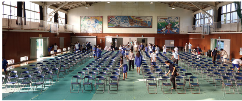
生徒さんたちが感染予防のため間を空けて椅子を並べ、消毒も