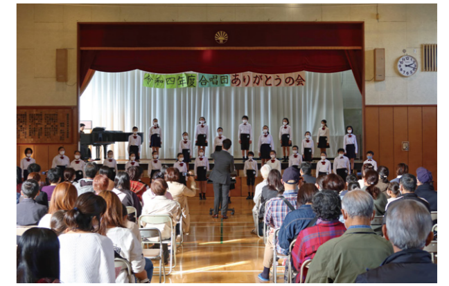
11月5日(土)に「ありがとうの会」を開催

まだまだ、練習ではマスクの着用と一人ひとりの距離をとる必要がありますが、工夫して練習に取り組んでいきます。」