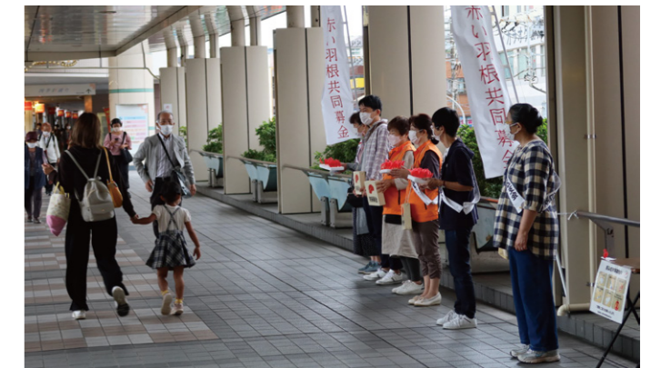
皆さんで手分けして、1時間交替で募金活動を行います

全国で寄付いただいたお金は、7割が各地域の福祉活動(社協、福祉施設、ボランティア団体等)の助成金として、残り3割が広域の福祉活動(災害時の支援活動等)に分配されます。寄付していただいた皆さま、ありがとうございました。