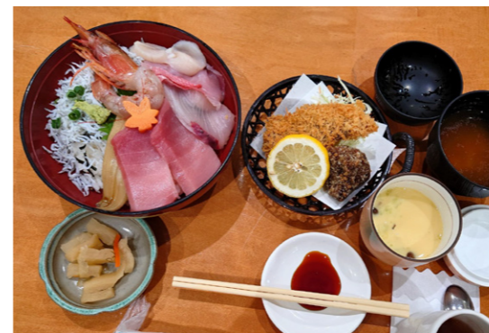
三崎の美味しい海鮮丼セット

当日はお天気も良く、途中で渋滞に遭うことも無く、快適で、秋の一日、楽しいバス旅行でした。