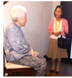
見守り活動 定期的に高齢者など のご自宅を訪問して日常生活に関 するお困りごとなどを伺っています