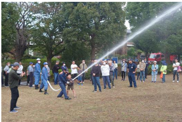
子どもたちも放水作業を体験