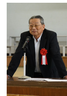
主催者挨拶は 来賓代表のご挨拶 出井善次社協会長代行