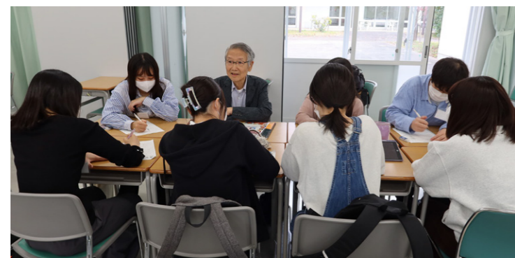
学生とかがやきクラブの方とのコミュニケーションの様子

<編集後記>毎年9月の第三月曜日が敬老の日です。今年も高齢者をご招待して「敬老のつどい」を9月30日(土)に開催することができました。儒教が伝わったアジア文化圏では高齢者を敬う国が多いですね。日本もその一つです。以前、高齢者施設を訪問した時に、若い職員さんが入所の方を「私たちの大先輩」と呼んでいたのが印象に残っています。最近、人生100年時代と言われていいます。会社勤めを定年で終えた人でも、更に新しい世界に足を踏み出すことができる時代になったのではないのでしょうか。いつまでも皆さんお元気でお過ごし下さい。