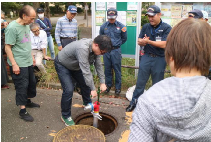
水道管の吐水口にスタンドパイプを接続