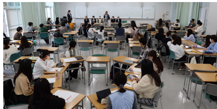
広い教室を使った「老年看護学概論」の授業風景

今回の地域の方々との交流が看護師として成長するうえで、大変有意義な授業となりました。授業にご参加いただいた「かがやきクラブ」の皆様、ありがとうございました。