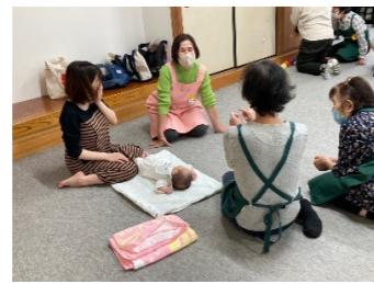
乳幼児・子育て世代の支援活動 子育てサロンの「わいわいクラブ」 を町内会館で毎月開催

お問い合わせ先： 牛山 080-5548-9081 正田 090-8034-4233