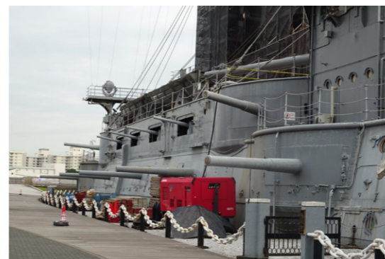
三笠公園にある戦艦みかさ