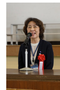
権藤由紀子区長が 来賓代表のご挨拶