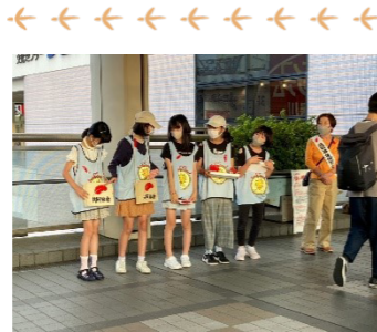
小学5・6年生のジュニア ボランティア育成活動 10月2日(月)に実施した赤い 羽根共同募金の活動に参加