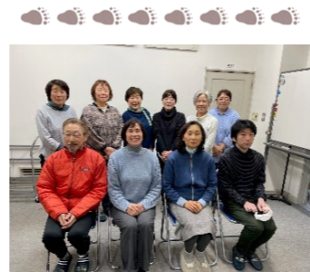
現在の民生委員と 主任児童委員さんたち 私たちと一緒にやりませんか？